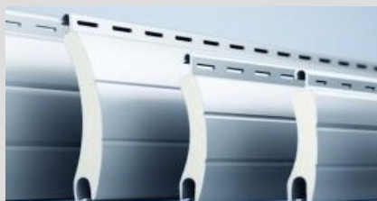
(doppelwandig ausgeschäumtes Aluminiumprofil)

Hierbei ist noch zu erwähnen, dass der Einbruchschutz durch Einbau von doppelwandigen Aluminium-Rollläden , in Verbindung mit „starre Wellenverbinder“ erheblich erhöht wird. Ein hochschieben des geschlossenen Rollladens ist praktisch nicht mehr möglich.